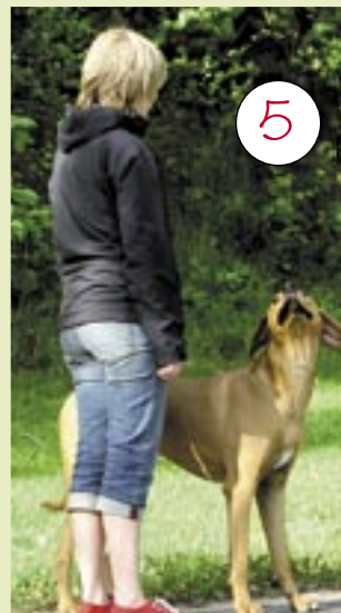
... där han frågar om lov.