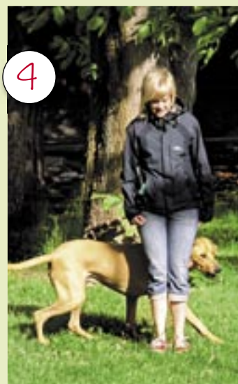
... och kommer till matte ...