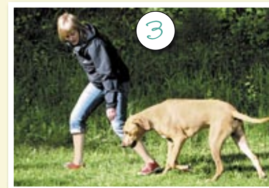
... hon får snabbt Benson att lugna ner sig, och Benson får beröm.