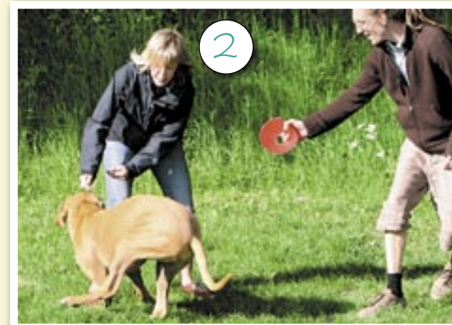
... men Helena säger tydligt NEJ ...